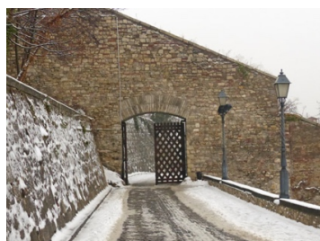
眼下の光景も、興味深い