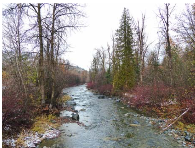
橋からの、眼下の光景