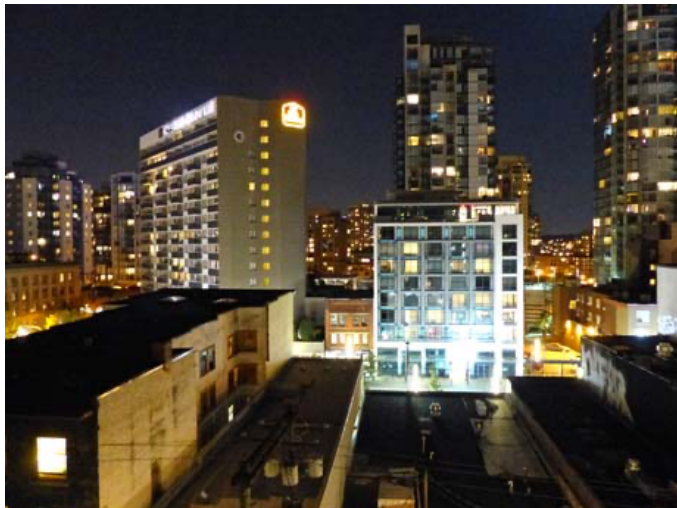
ホテルの部屋から