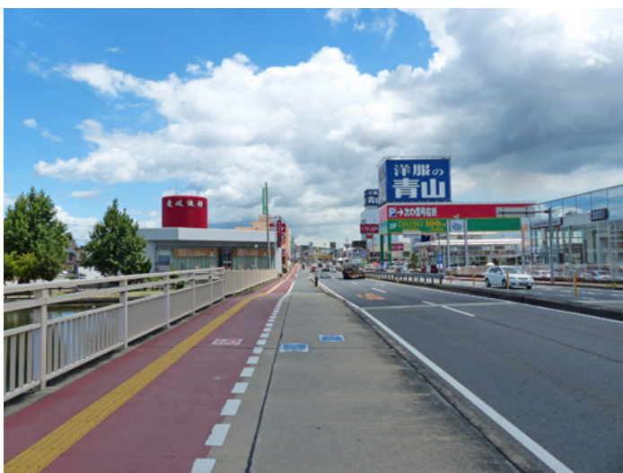
道路状況も、場所でいろいろ