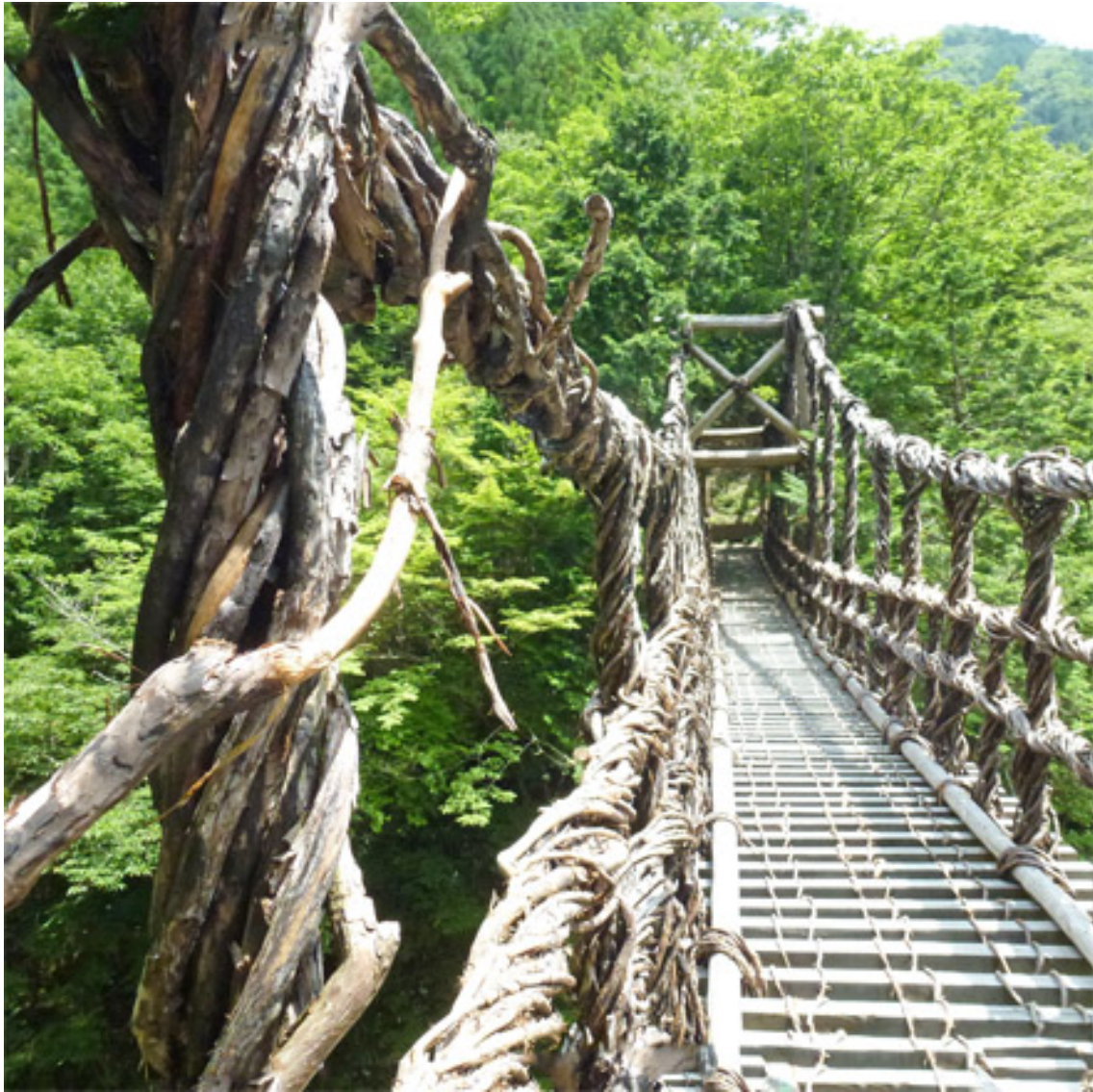
～～日本のかおり：四国・東祖谷・トレッキング～～