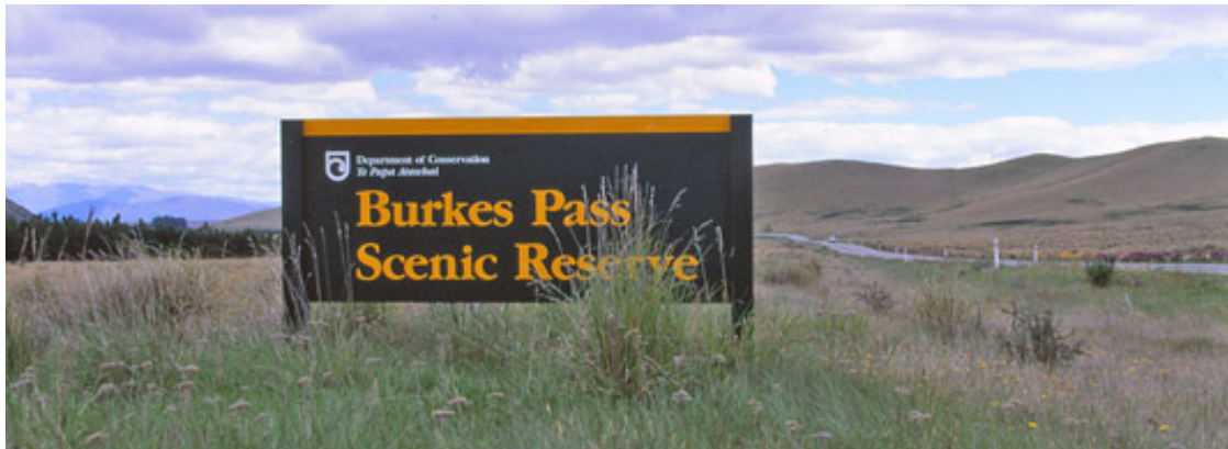
バークス峠、カンタベリー地方南部

アラスカや北米、中米、中国、欧州大陸とも違う。NZ は、南半球。 南北、国立公園は、何度か、時間をかけて、一応訪問。話を本題に戻して、この後、 3月の発信は、NZ。 南北ニュージーランドを、無作為に、ご紹介の予定。