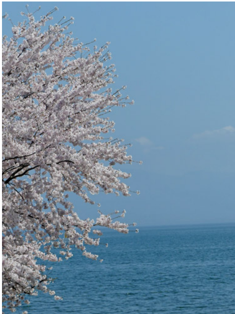
琵琶湖にて、この小さな旅の道中にての出会い。

今年の気温は高いらしい。いろいろ熱中症への注意事項が紹介されていた。素直に配慮したい。