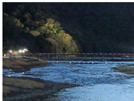
日没の嵐山・渡月橋