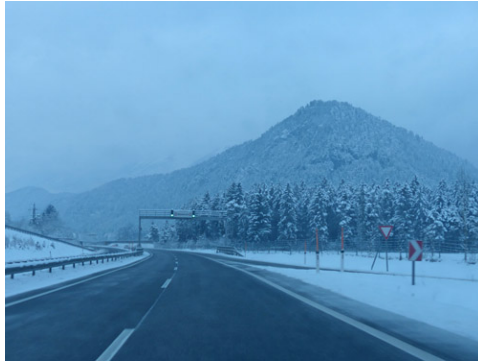
絵になる光景にも遭遇。

とは言いながら、駐車スペースでは、車外へ何度も出て、 周囲の森や山を観察しながら、柔軟体操はじめ、体調を整えることにも配慮。 道路の路面なども、素手で確認。待った無し、言い訳なし。 仕事面も、光景の瞬きを捉えて画像記録を蓄積。