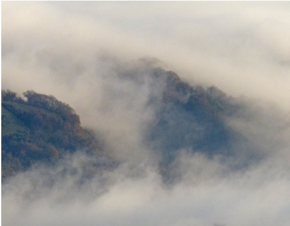
アドリア海を望む